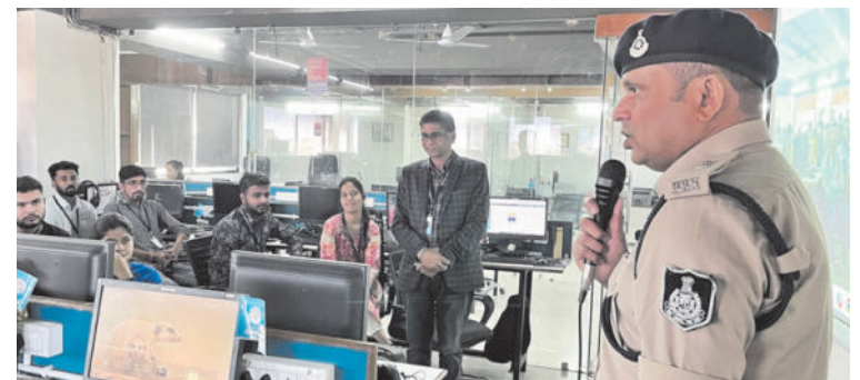
गुड इवनिंग, इंदौर

में बढ़ते साइबर अपराधों पर अंकुश लगाने के लिए, इसके प्रति लोगों में जागरूकता लाने के उद्देश्य से, पुलिस कमिश्नर इंदौर के दिशा निर्देशन में विभिन्न कार्यक्रमों का आयोजन किया जा रहा है।