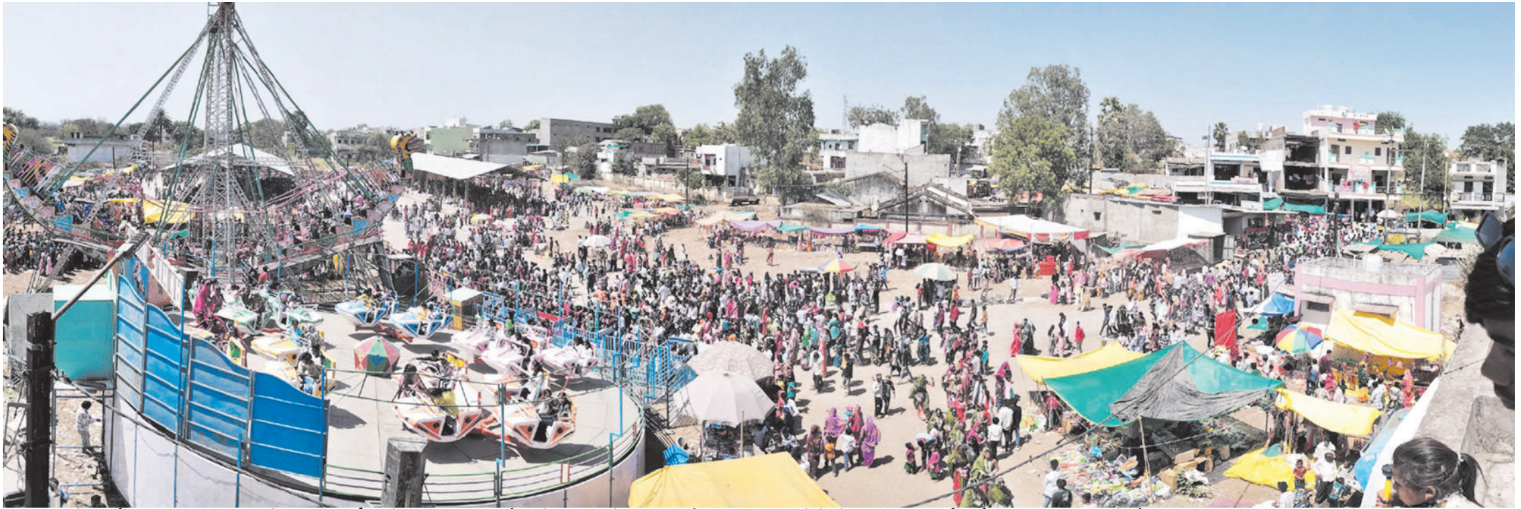
झाबुआ में भगोरिया उत्सव अपने अंतिम दौर में पहुंच चुका है। देशभर से इस पर्व का आनंद लेने के लिए हजारों लोग यहां पहुंच रहे हैं।