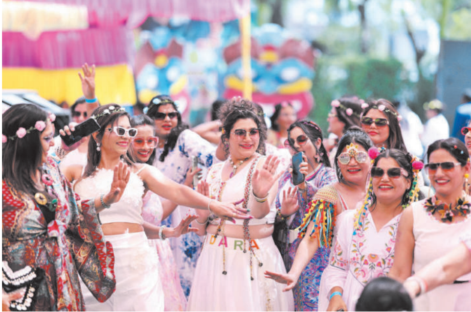
गुड इवनिंग, इंदौर