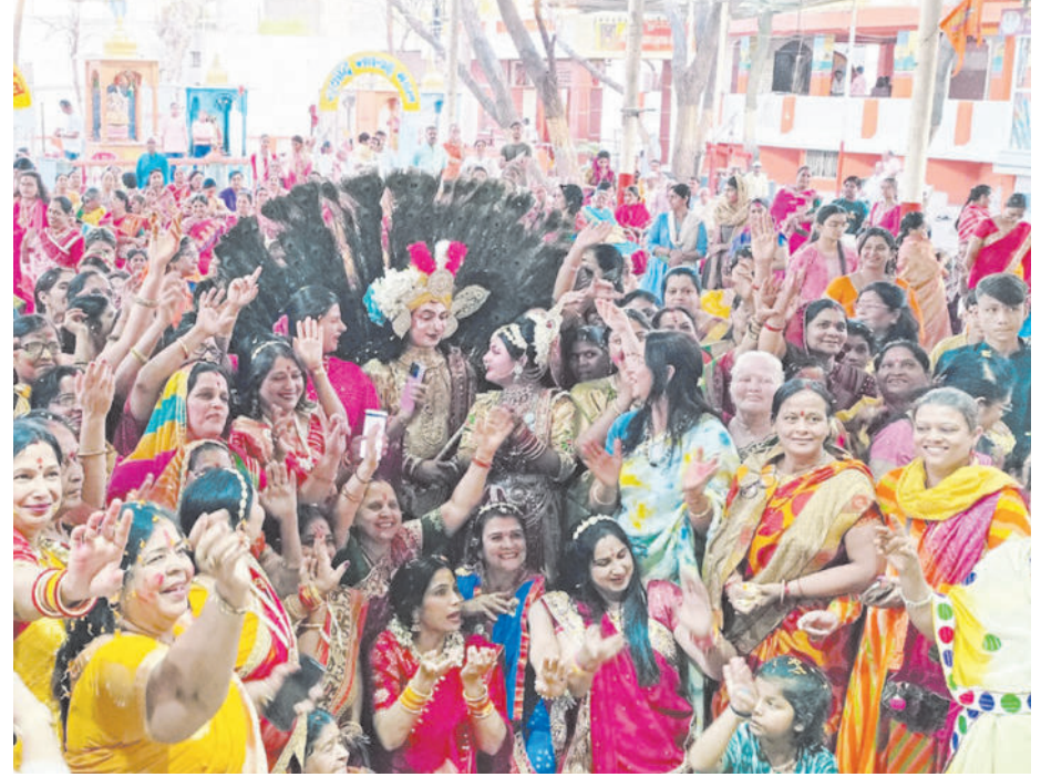
नाचते-गाते हुए पूरे उल्लास के साथ इस उत्सव का आनंद लिया। करीब तीन घंटे तक चले इस महोत्सव में सखियों का उत्साह निरंतर बढ़ता ही गया। मयूर नृत्य में भी बहनों ने उत्साह से भाग लिया।